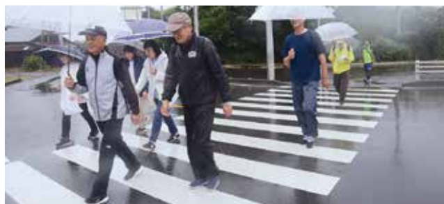
▲雨の中一生懸命歩く参加者ら

今回は雨のため、5kmコースのみの実施となりました。馬頭支店をスタート・ゴール地点とし、武茂川沿い、国道293号線、馬頭公園の横を南回り、北回りに分かれて6班でのウォーキングを行いました。雨で足元が悪いところもありましたが、JA職員が声かけをし、無事全員が完了しました。