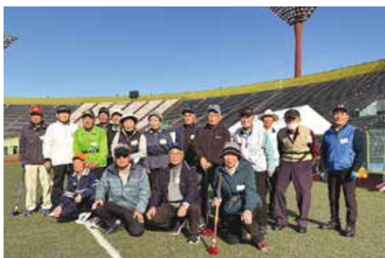
▲県大会に出場した選手ら

「はつもの味だより」は、地元産の新鮮な農産物や加工品を詰め合わせた季節の贈り物です。今回は管内産の新米コシヒカリやナス、ニラ、菌床シイタケ、キュウリ、サトイモの他に、梨「にっこり」や手作り味噌の計8品が入っています。J A 担当者が一つひとつ丁寧に箱詰めし、全国へ旬の味を届けます。今回の発送は12月に予定しており、料金は1便7,500円(税込)です。今後も新鮮な農産物を通じてJ A の魅力を全国へ届けるために、同活動に取り組んでいきます。