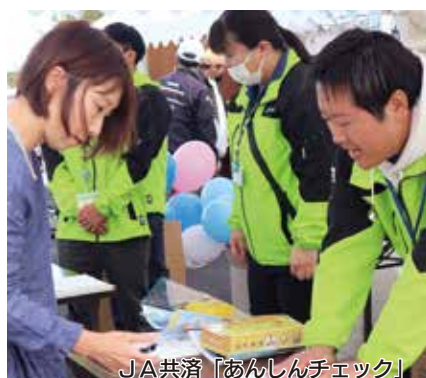
JA共済「あんしんチェック」