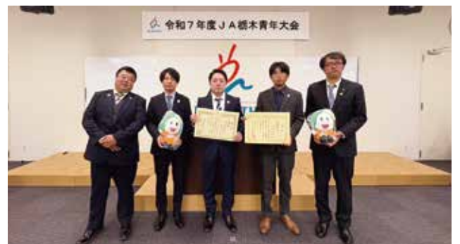
▲大会に出場した部員ら

青壮年部は10月9日と14日に、リハビリテーション歩で農産物販売を行いました。今回は予約注文をした梨「にっこり」の販売を行いました。