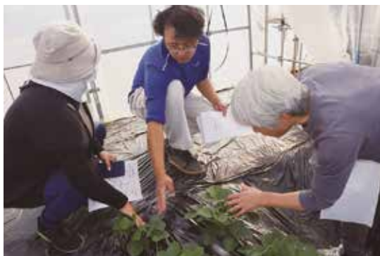
▲生育状況を話し合う部会員ら