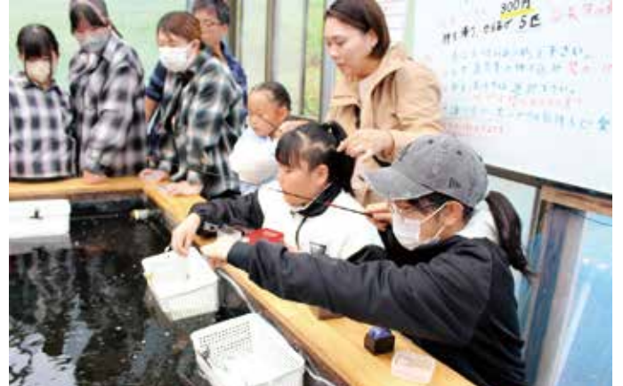
▲ホンモロコ釣りを楽しむ会員ら

記事活用では参加者が好みの生地を準備し手帳カバーを作りました。終了後はフルーツファーム烏山に移動し、リンゴ狩りを楽しみました。