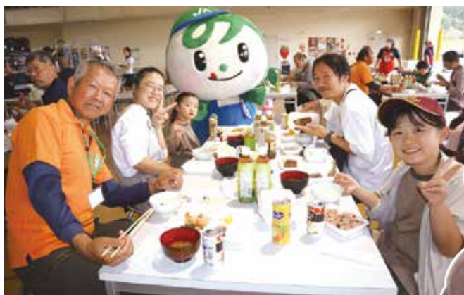
▲なすみんと交流を深めた参加者ら 提供された新米のコシヒカリ▶

換をしました。会場ではJ A職員やJ A女性会員らが、新米コシヒカリ、とちぎ和牛や鮎の塩焼きを振る舞いました。他にもJ Aマスコットキャラクターの「なすみん」との交流や青空市直売会も催され、充実した時間を過ごしました。