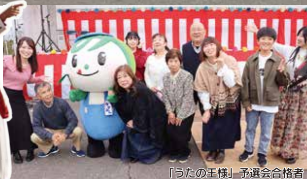
「うたの王様」予選会合格者