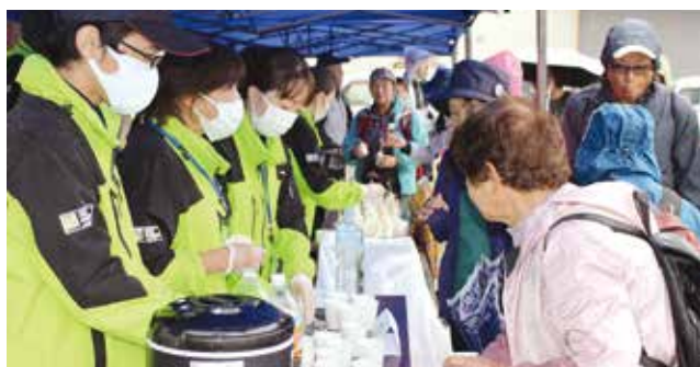
▲休憩所で職員からお茶を提供される参加者ら