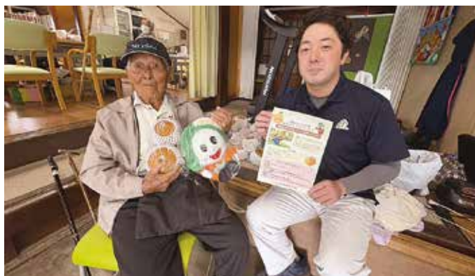
▲注文した品物を受け取った利用者と部員

青壮年部は10月9日と14日に、リハビリテーション歩で農産物販売を行いました。今回は予約注文をした梨「にっこり」の販売を行いました。