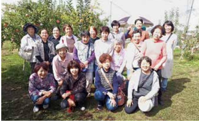
▲リンゴ狩りに参加した会員ら

女性会烏山地区の18人は10月15日に、家の光記事活用講座「手帳カバー作り」とりんご狩りを行いました。