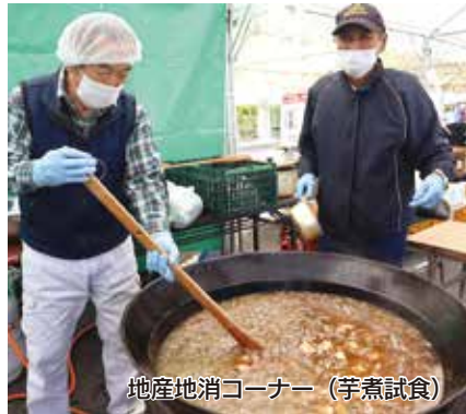
地産地消コーナー（芋煮試食）