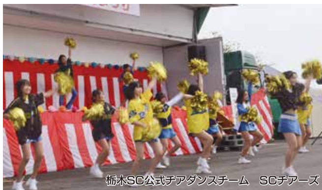
栃木SC公式チアダンスチーム SCチアーズ

今年のJAまつりにご来場いただいた地域の皆さま、ご協力・ご出演いただいた関係者の皆さまのお陰で大盛況となりました。本当にありがとうございました。