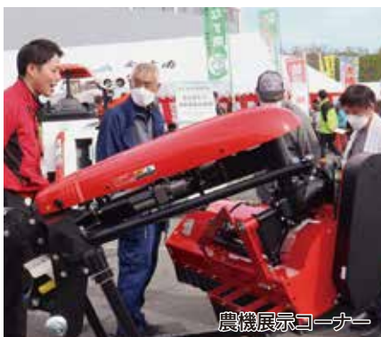
農機展示コーナー