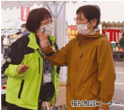
福祉相談コーナー