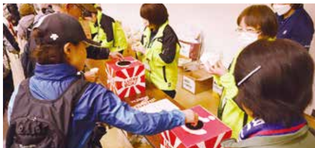
▲抽選を行う参加者ら