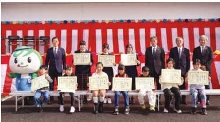
▲書道の部で受賞されたみなさん