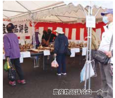
農産物品評会コーナー