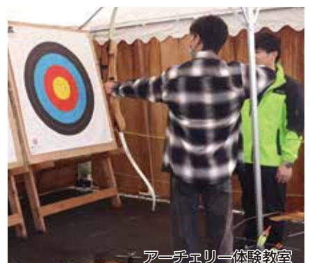
アーチェリー体験教室