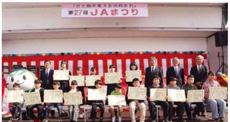
▲絵画の部で受賞されたみなさん