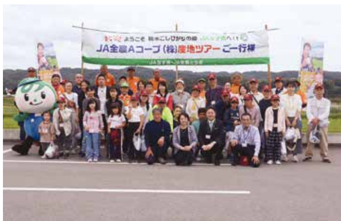
▲稲刈りツアーに参加した消費者ら