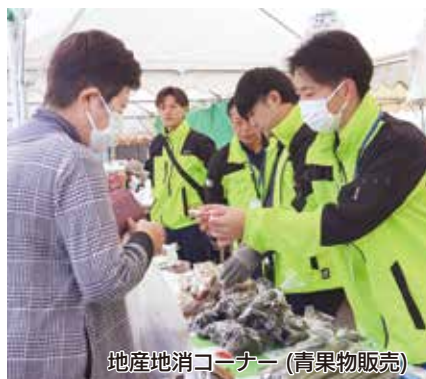
地産地消コーナー（青果物販売）