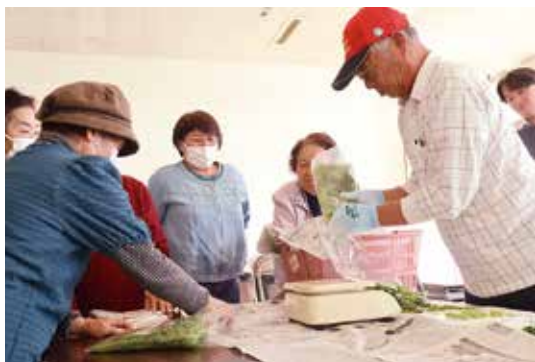
▲袋詰め作業の実演を見る部会員ら

JA春菊・きゅうり部会は10月23日に、JA小川集会所で令和7年度春菊の出荷目揃え会を行いました。部会員と関係者ら26人が参加し、出荷に向けて規格を確認しました。