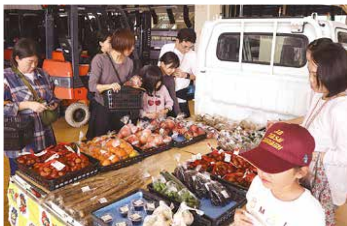
▲直売会の農産物を吟味する参加者ら

参加者は「稲刈りツアーを通じて生産者の苦勞を体験できた。これからは今まで以上に生産者に感謝して食べ物をいただきたい」と話しました。