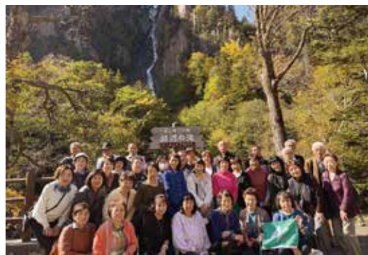
▲旅行に参加した参加者ら

JAは10月1日から3日にかけてJA定期積金旅行を実施しました。34人が参加し、秋の北海道の観光名所を巡りました。