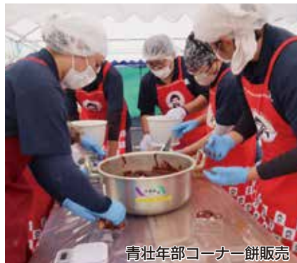
青壮年部コーナー餅販売