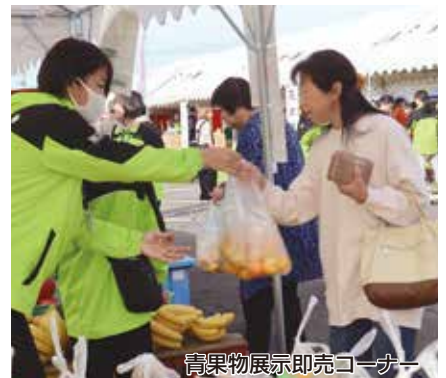
青果物展示即売コーナー