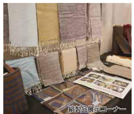
絹製品展示コーナー