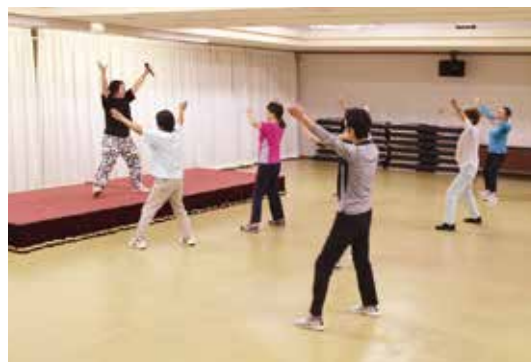
▲講師の動きを見てエアロビクスをする参加者ら

JA女性大学「あじさいカレッジ」は10月14日に、JA馬頭支店会議室で令和7年度第5回講座を実施しました。今回は「エアロビクス教室」を行い、受講生19人はエアロビクスを通して元気に体を動かしました。