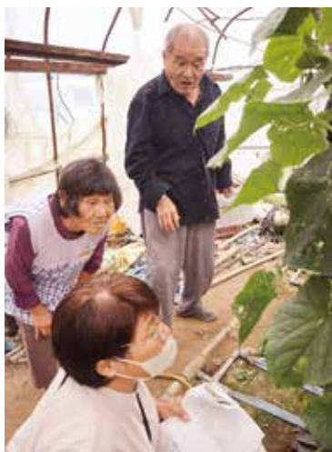
▲生産者と生育を確認する参加者

JAは10月7日に、那珂川町のほ場でキュウリほ場見学会を実施しました。見学者と関係者ら5人が参加し、栽培方法などを学びました。