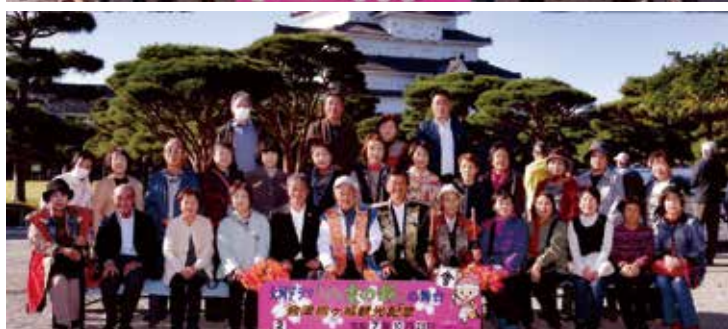
▲旅行に参加した会員ら