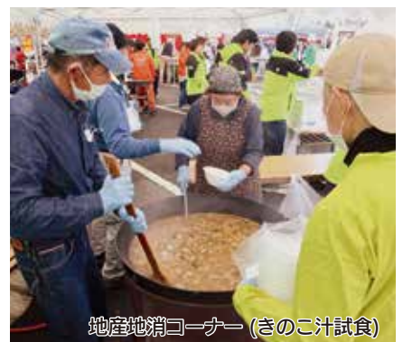
地産地消コーナー（きのこ汁試食）