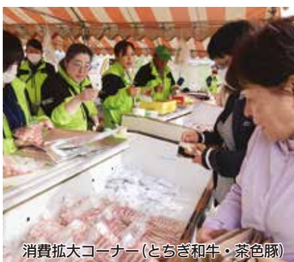
消費拡大コーナー（とちぎ和牛・茶色豚）