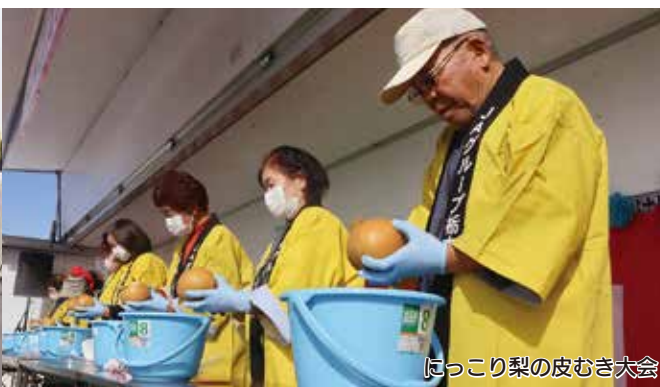
にっこり梨の皮むき大会