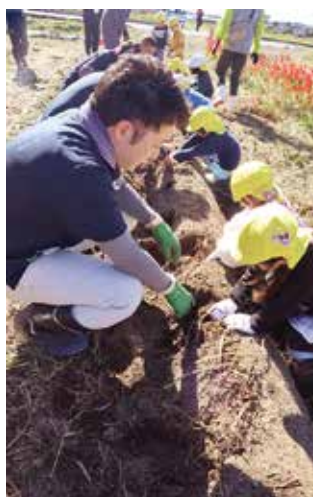
▲部員と一緒にイモ掘りをする園児ら