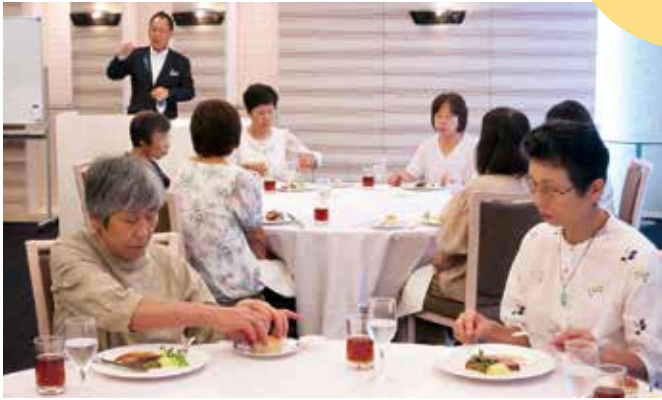
▲マナーを学びながら食事を楽しむ受講生ら