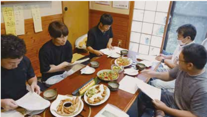
◀役員会で話し合う部員ら

青壮年部は7月12日、ことぶき食堂で役員会を開き、今後の活動について話し合いました。