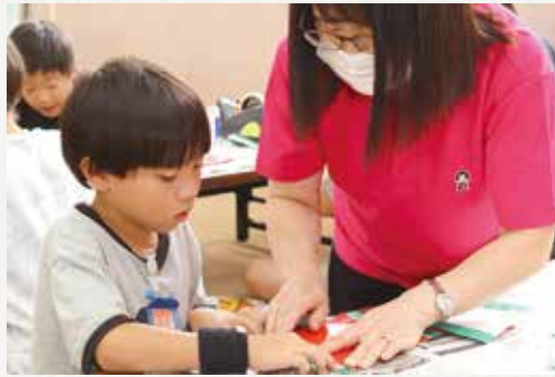
▲スイカのうちわを作る役員と児童ら▲