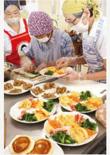
▲色とりどりの食材を使って調理する会員ら

青壮年部は7月12日、ことぶき食堂で役員会を開き、今後の活動について話し合いました。