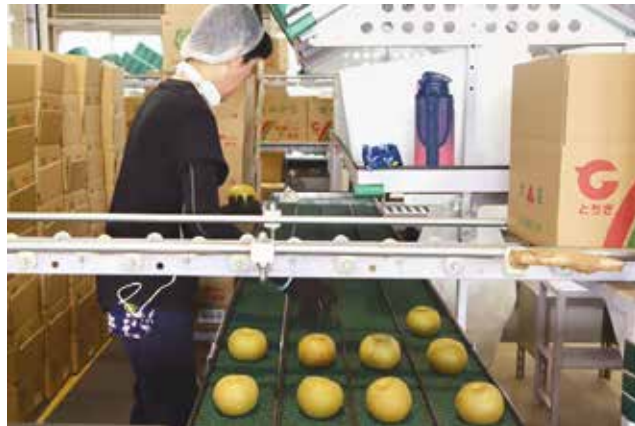
▲基準に沿って箱詰めする作業員

機械選果で行います。そのため、選果初日にJ A担当者や選果員らは、選果基準を確認。基準に沿って色や傷などを目視し、選果機で品質異常を除きます。高品質な梨を出荷するため、梨は軸を下にして、階級ごとの箱に詰めるよう作業の統一を図りました。