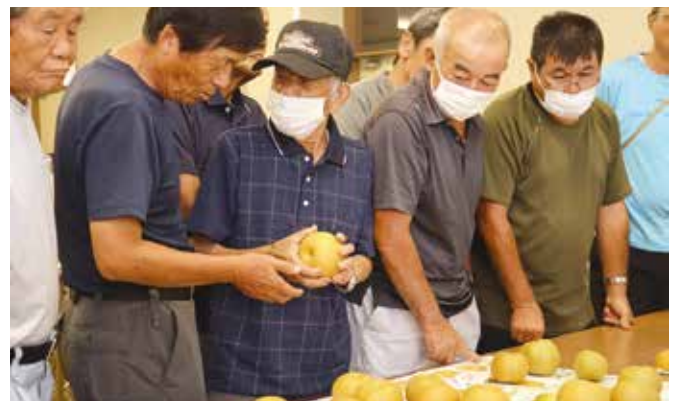
▲出荷基準を目合わせる部会員ら

J A職員は一箱の重さを4キロに合わせて箱詰めするよう呼びかけました。部会員らは現物を手に取り、形や色、傷などを確認しました。また、収穫するタイミングなどを話し合い、理解を深めました。