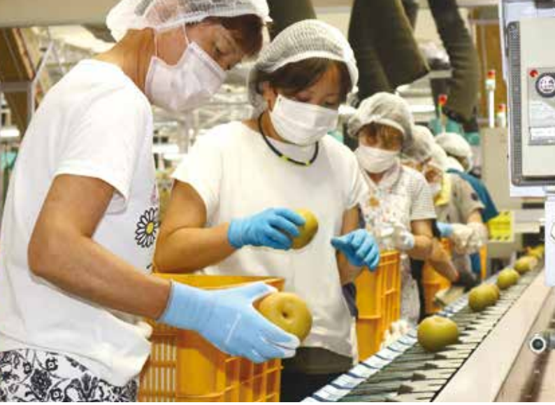
▲梨の色や傷などを確かめる選果員ら