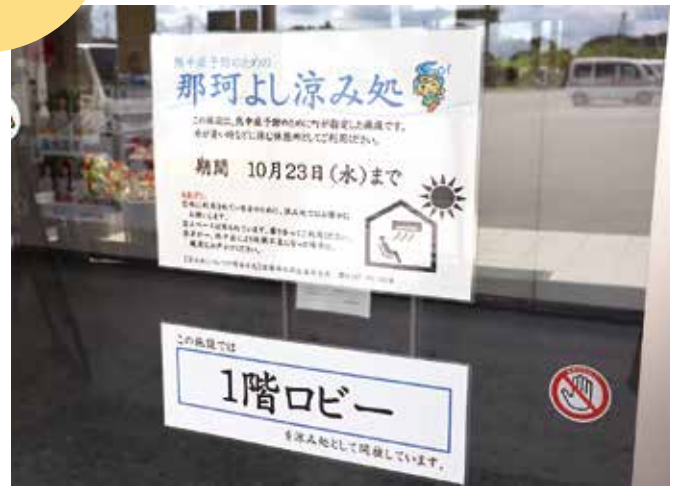
▲本店1階に掲示しているPOP