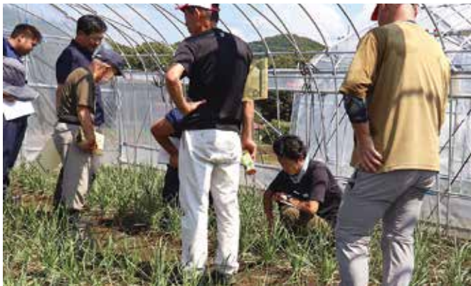
▲生育状況を確認する部会員と関係者ら

同J Aは期間中、「那珂よし涼み処」のPOPを施設に掲示し、通りがかりの人に周知します。