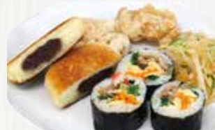
▲出来上がった料理