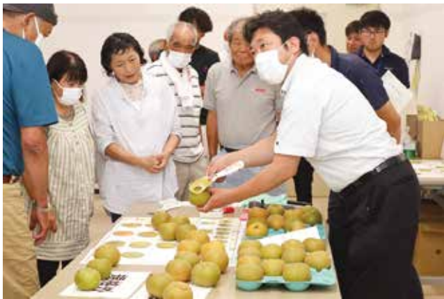
▲カラーチャートで確認する部会員と市場関係者ら

機械選果で行います。そのため、選果初日にJ A担当者や選果員らは、選果基準を確認。基準に沿って色や傷などを目視し、選果機で品質異常を除きます。高品質な梨を出荷するため、梨は軸を下にして、階級ごとの箱に詰めるよう作業の統一を図りました。