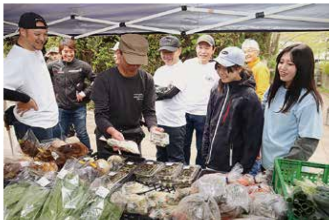
▲商品を手にする観光客ら