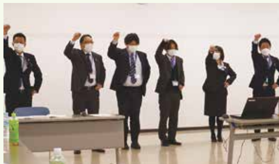
▲ガンバロー三唱をする新任LAと支店長ら

J Aは4月16日、本店で令和6年度LA進発式を開きました。LAや役職員、J A共済連栃木関係者ら25人が参加し、決意新たに今年度の業務をスタートしました。