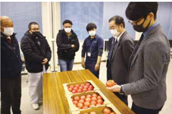
▲出荷基準を確認する部会員

ました。市場担当者は収穫時の色目に注意して出荷して欲しいと呼び掛けました。高野部会長は「消費者に高品質で味のいいトマトを出荷したい」と話しました。現在同部会は6人で、14名作付けています。令和6年産の販売数量は、2百トを目指します。