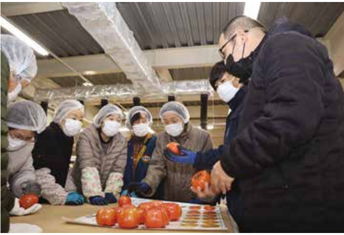
▲選果基準を確認する選果員

J A馬頭トマト部会が作る「桃太郎トマト」の出荷が始まりました。令和6年産は病害虫被害がなく生育順調で、品質も申し分ありません。選果は3月8日からJ A梨・トマト選果場で始まり、6月末まで続く見込みです。