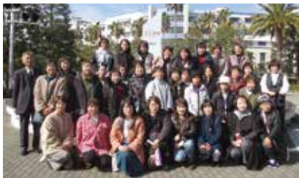
◀日帰り観劇ツアーに ▼参加した会員と役員