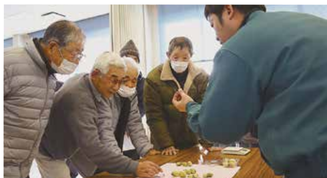
▲目合わせをする部会員