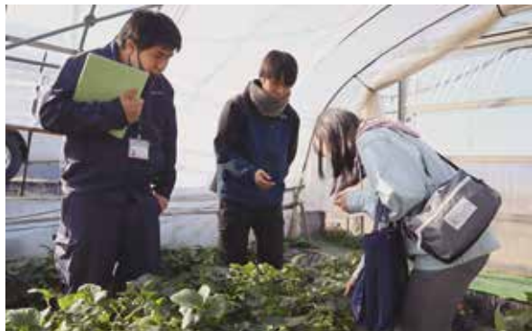
▲イチゴのほ場を見学する見学希望者

J Aは、6年度も1年間かけて11品目計16回のほ場見学会を実施する予定です。昨年に引き続き、園芸品目の生産拡大を進めていきます。