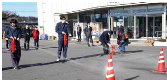
▲消防訓練を行う職員ら

6年産フキノトウは、暖冬が続いているため例年より生育が遅れていますが、少しずつ回復に向かい出荷量が増えていく見込みです。目ぞろえ会で部会員は、実際にサンプルを手にし、蕾の大きさや開き具合などを確認。市場担当者は、有利販売に繋げるため出荷日等の連携をしっかりとし、蕾が大きく形の揃った商品を出荷して欲しいと話しました。