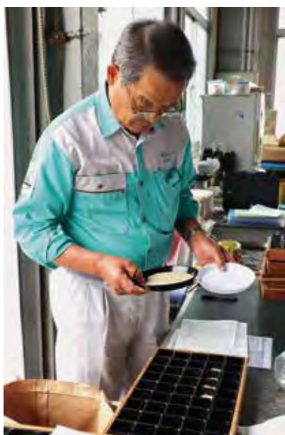
▲目視で検査する検査員

JAでは、9月5日から令和5年産の米検査が始まりました。管内の米倉庫5カ所で、JA農産物検査員が、着色粒や被害粒、死米などがなにか形や色などを見て品質を確かめました。