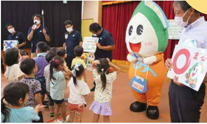
▲青年部太郎と一緒に食育クイズをする園児