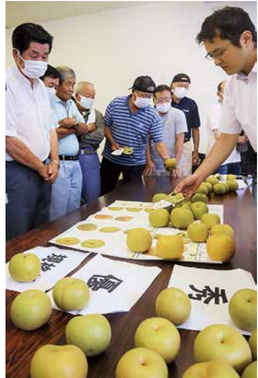
◀規格を確かめる部会員ら(幸水)

傷の具合など出荷基準を確認。高品位な梨の出荷を申し合わせました。現在、同部会では「あきづき」を出荷中。順調な出荷を続け「新高」、「にっこり」まで梨りレーを続けます。