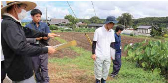
▲質問する見学希望者