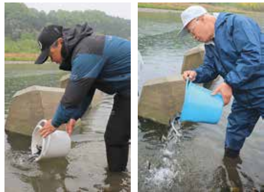
▲アユを放流する岡崎組合長⑤、福島町長

同取組みは、那珂川町のアユ放流事業の一環で、6月1日のアユ釣り解禁に向けて毎年行なっています。昨年の産卵状況がとても良かったことと春先から水温が高めなことで、3月中旬から天然アユの遡上があり近年にな