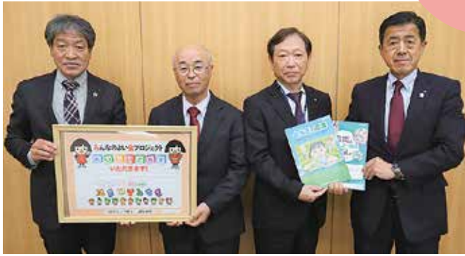
▲福島町長(左から2人目)と吉成教育長(同3人目)に学習教材とランチョンマットを贈呈する中山組合長㊦と荒井専務