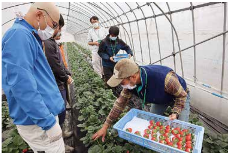
▲部員のアドバイスを受ける参加者⑥

J Aと行政が一体となり担い手を支援する南那須地域新規就農者支援対策協議会は11月26日、那珂川町でイチゴ農作業体験会を開きました。4組7人が参加し、イチゴの収穫から出荷調整作業までの一連の流れを体験しました。