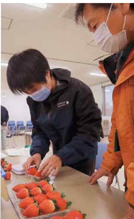
▲パック詰めをする参加者⑦

同体験会はJ A管内で就農を希望する新規就農希望者が対象です。今回の農作業体験ではJ Aいちご部会青年部員とグループになり、参加者へ指導しました。実際に1箱（4パック）分のイチゴの色や形を見ながら、同部会の出荷規格に基づき収穫。部員らは「茎を引っ張りながら採ると株元が弱ってしまう。また、果肉に手跡が残るため、茎とヘタの間に手を入れて収穫しよう」とアドバイスし、話をしました。