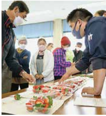
▲サンプルを手に出荷基準を確認する部会員ら

5年産はやや小玉傾向ですが、目立った病害虫の被害もなく品質良好です。JA担当者は「パック詰めの際、特に大玉は箱が果実にあたり傷みがでる恐れがある。強すぎず緩すぎずにラップを貼ってほしい」と注意を促しました。