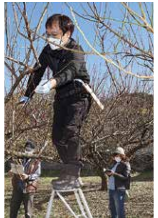
▶剪定方法を説明する石下副主幹