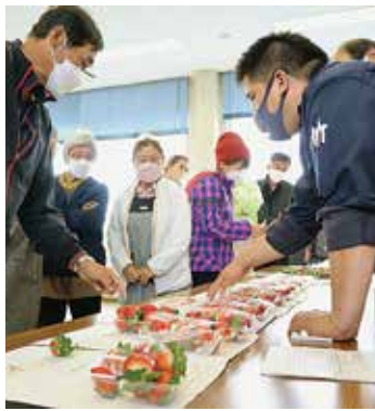
▲サンプルを手に出荷基準を確認する部会員ら

JAいちご部会は11月21日、JA都青果物集荷所で本格出荷を目前に、令和5年産「とちおとめ」「とちあいか」の出荷目ぞろえ会を開きました。部会員や市場関係者ら31人が参加。大きさや形状など出荷基準を統一しました。