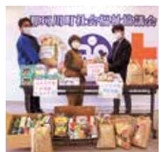
▶那須烏山市社会福祉協議会へ