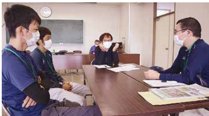
▲就農相談で不安を解消

就農相談会では、行政や部員、JA担当者らが各組に入り、参加者の話を聞きながら不安を解消しました。参加者らは、初期費用の他、初心者でも扱いやすい品種や管理方法などを質問。担当者らは、より具体的なイメージをもってもらえるようパンフレット等を使って説明し、就農後のサポート体制も万全で安心して就農できるよう話