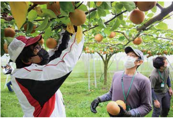
▲部員のアドバイスのもと収穫作業を体験する参加者

南那須地域新規就農者支援対策協議会は10月16日、那須烏山市で梨・農作業体験会を開きました。JA管内で就農を希望する新規就農希望者が対象で、4組5人が参加。梨の収穫から出荷調整までの一連の流れを体験しました。