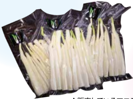
▲販売しているマコモタケ