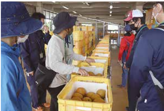
▲選果場を見学する参加者

同協議会は、新規就農者支援を目的として、令和2年度にJAと行政が一体となって新設した組織です。農業研修を通じた技術指導の他、居住地確保などの生活支援体制を強化し就農希望者が農家として自立できるように関係機関がトータルサポートをしています。 JA梨部会研究部員が2人1組になり、参加者へ指導しました。実際に7玉(1箱分)を、色や形を見ながら収穫。部員らは「梨は水分量が多く、収穫ばさみが刺さりやすいため気を付けて欲しい」「芯が長いと梨同士がぶつかって穴が開いてしまうため短く切ろう」とアドバイスし、普段から意識する収穫時のポイントを話しました。作業体験後は、JA梨・トマト選果場で梨の出荷手順を見学。梨担当者が選果方法や箱詰めの様子を説明しました。