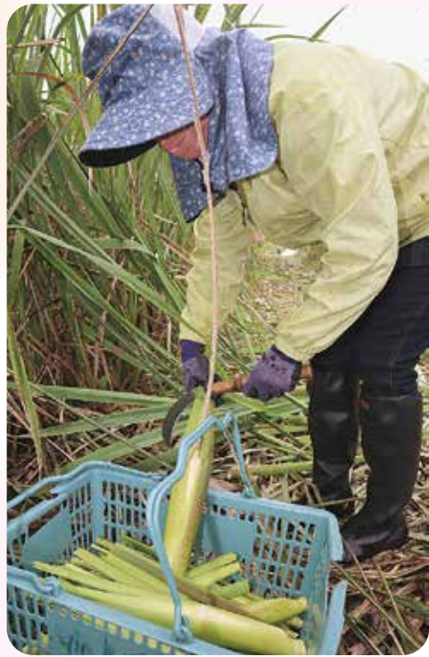
▲マコモタケを収穫する会員