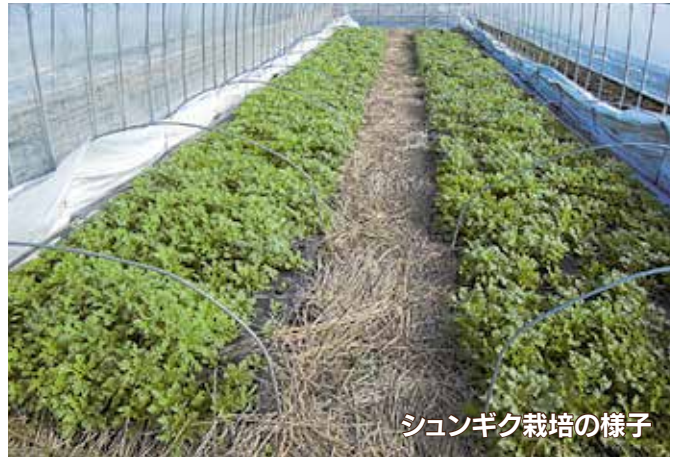
シュンギク栽培の様子

詳しくは、広報誌折込チラシをご覧ください。 お問合わせ先 園芸販売課 (TEL96-6170)