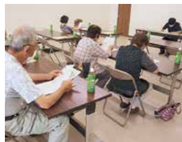
▲栽培管理について説明するJ A担当者と部会員

J A春菊・きゅうり部会は7月27日、J A小川集会所でシンギクの栽培講習会を開きました。部会員、J A担当者ら17人が参加し、今後の栽培管理を学びました。