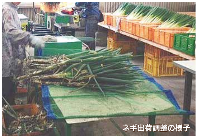
ネギ出荷調整の様子