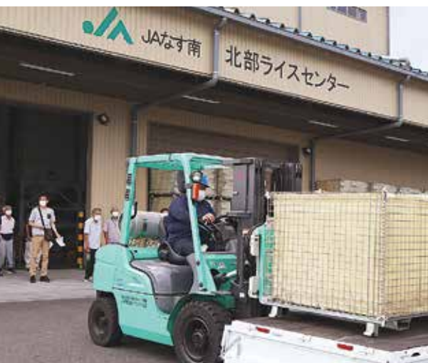
▲コンテナを荷台に載せる担当者

J Aは8月27日、北部、藤田ライスセンターで共同乾燥調製施設利用説明会を行いました。利用検討者やJ A担当者ら24人が参加。ライスセンターの利用方法や荷受けの流れを説明しました。