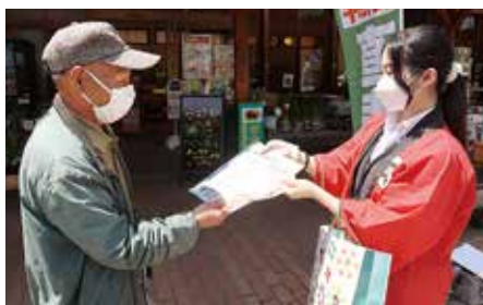
▶プロジェクトを来店者に説明する職員

J Aは5月18日、道の駅ばとうで「みんなのよい食プロジェクト街頭宣伝」を行いました。