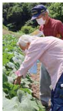
▲生育状況について意見を交わす部会員

「みんなのよい食プロジェクト」とは、消費者の皆さんに、国産・県産・地元産の農畜産物の豊かさや魅力を広め、地元の野菜や農業のファンになってもらおうという運動です。来店客に地産地消を呼び掛け、よい食プロジェクトのうちわやチラシを配布。 プロジェクトを紹介しながら、地元産農産物の魅力をPRしました。