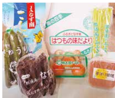
▲旬な農産物を入れたふるさと便

J Aでは毎年、農産物直送便「はつもの味だより」を年4回、全国の消費者へお届けしています。5月26日、27日には、桃太郎トマトや山フキなど7品目を詰めた第1便37個を発送しました。