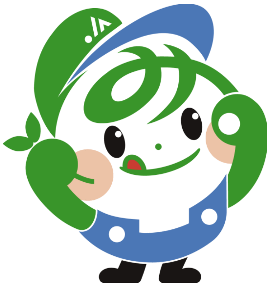
JA なす南イメージキャラクター「なすみん」